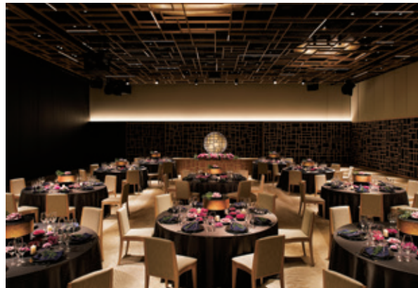
アルブル / ARBRE