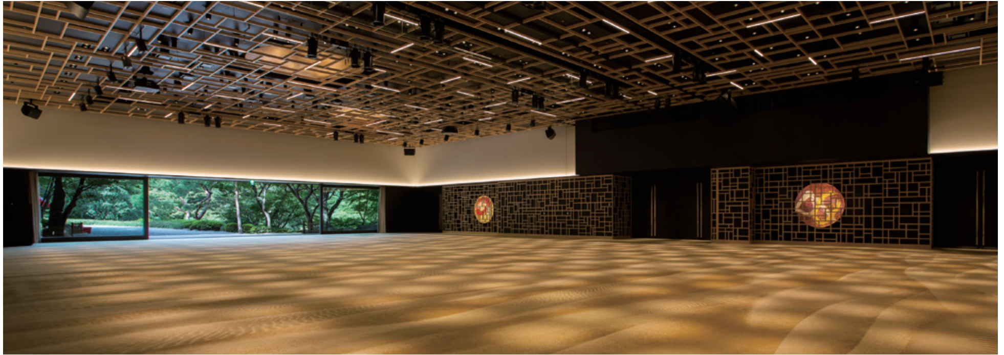
ジュール / JOUR