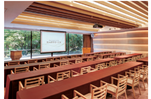
ニュイ / NUIT