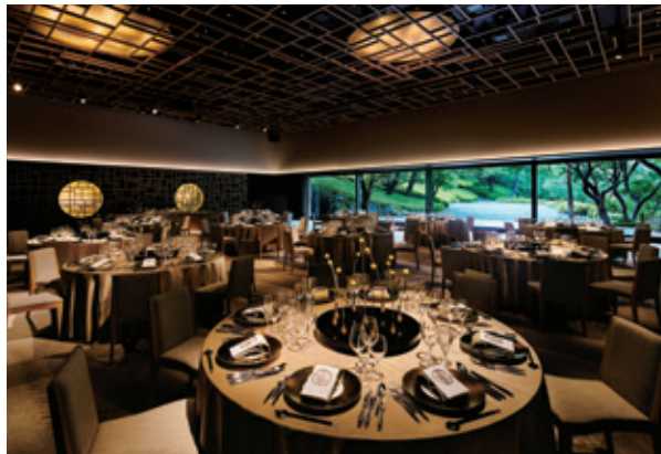
エール / AIR