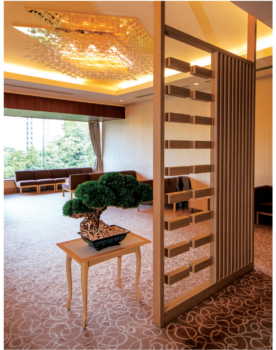
白兔 / HAKUTO