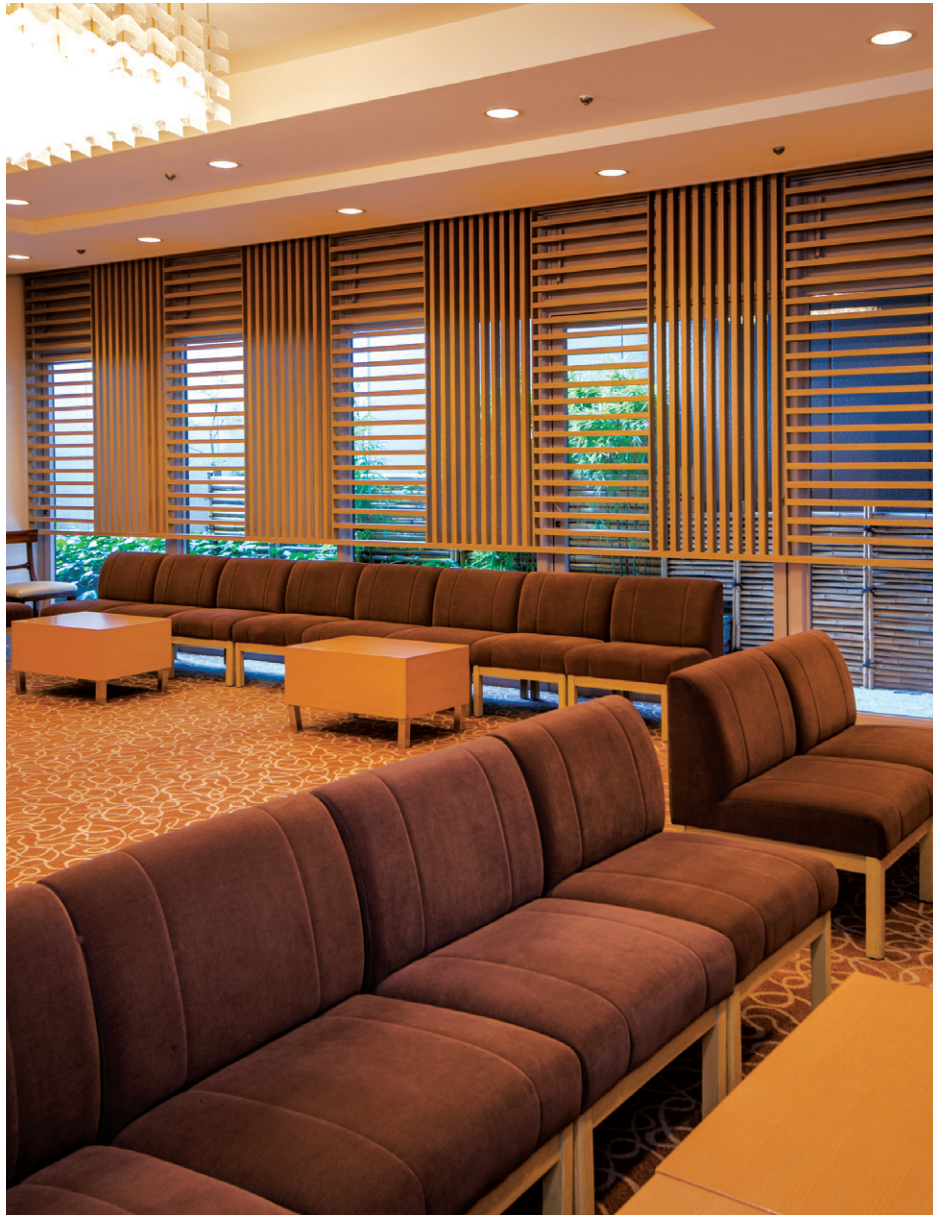
末広 / SUEHIRO